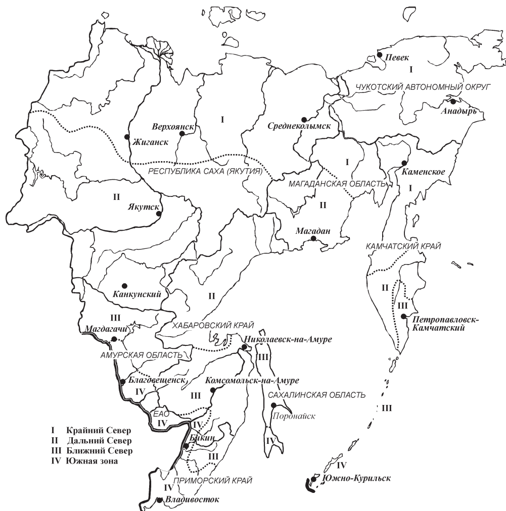
Рис. 1. Размещение метеостанций

Технически этот этап макроэкономического зонирования предполагает сопряженный анализ ландшафтных и общеэкономических карт. В нашем случае это были уже упомянутые работы А. Г. Исаченко и ряда других исследователей, посвященные ландшафтному зонированию Дальнего Востока, и экономическая карта Дальневосточного федерального округа [9].